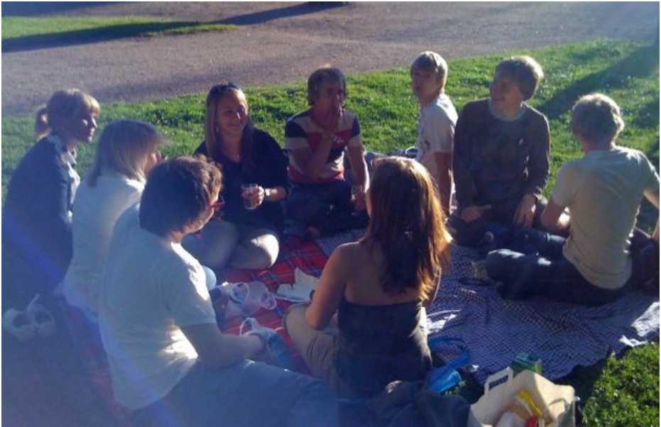
iPhonella otettu kuva Johanneksen takapihalta