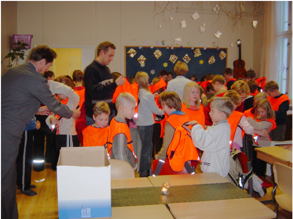
Suomalaisia lapsia, jotka ovat turvassa. Tehtävä: väritä liivit oranssiksi.

Kaupungilla näkee usein pienten huomioliivinassikoiden homogeenisiä joukkoja kulkemassa leikkipaikalle. Niistä lapsista kasvaa ihmisiä, joiden mielestä huomioliiveissä pyöräilevät valopäät ei ole urpoja. Ne varmaan käy sitten myös