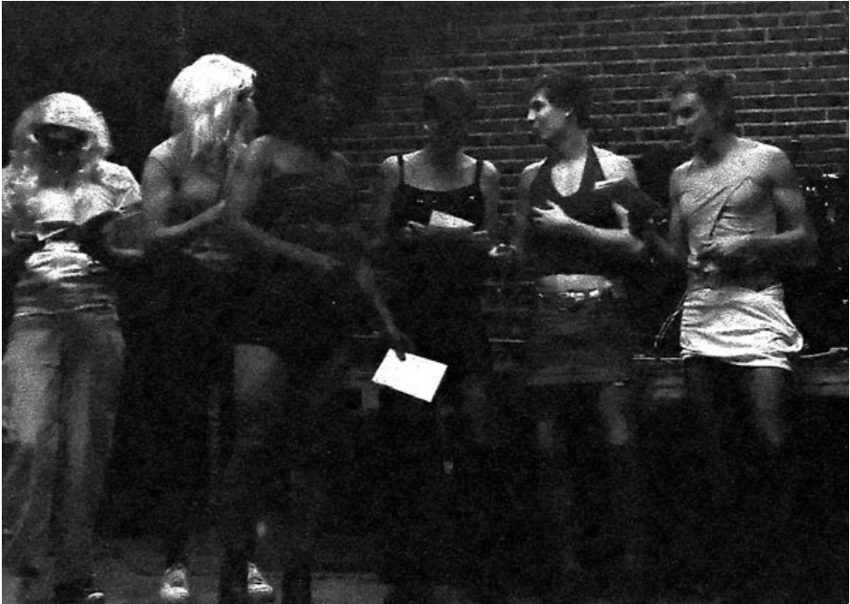
Kuvan transut ei liity tapaukseen.