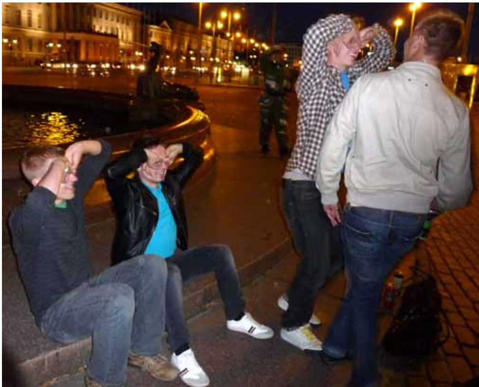
"TIK yllätti, ehkä" Kuvassa Tietokilta.

Kossusessio löytyi Kukka turmelee seksin* Hercules tuli Xena sai* Teekkarilauuopisto Verkostoseksi sujuu! TIK yllätti, ehkä Aalto yllätti seksi-innovaatiolla Hakula pieksi fuksin salaa: halusi paskaa seksiä* *: esitettiin illan aikana