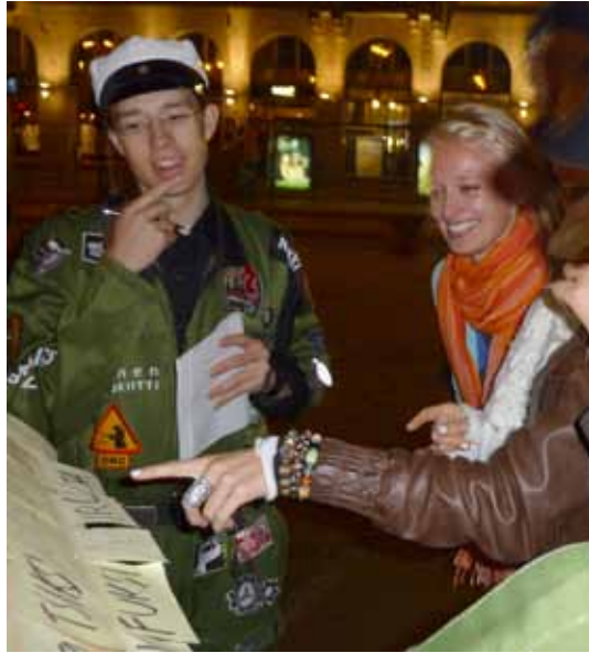
"Kyllä se on lause, eilen oli Hesarissa tällanen otsikko!"

Tämän jutun loppuksi on tunnustettava, että fuksihin yritettiin iskostaa kiltalehden tekemiseen liittyvät kolme perustotutta: juttuideat ovat kokoajan esillä, mutta silti kiven alla, koska et tiedä mihin sioutout, ja että teit kuinka paljon töitä tahansa, yleisö huutelee silti arvauksia. ■